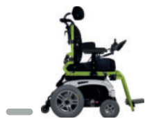
Kompaktes Fahrgestell mit Vorder- oder Hinterradantrieb