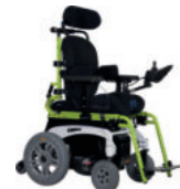
Modulare Auswahl der Konfiguration zur optimalen Versorgung